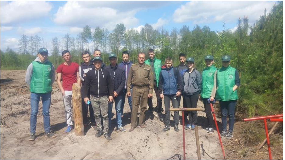
Студенти під час роботи